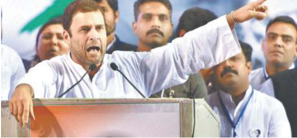
इंदिरा गांधी की 98वीं जयंती के मौके पर एक कार्यक्रम में बोलते राहुल गांधी।

नई दिल्ली। राहुल गांधी की कथित दोहरी नागरिकता के विवाद ने संसद के शीत सत्र से पहले ही सरकार और विपक्ष के बीच तलख राजनीतिक टकराव की बिसात बिछा दी है। कांग्रेस उपाध्यक्ष राहुल गांधी ने साफ कहा कि उनके पास ब्रिटेन की नागरिकता होने का जो आरोप सुब्रमण्यम स्वामी लगा रहे हैं उसके पीछे पीएम मोदी का हाथ है। उन्होंने कहा कि प्रधानमंत्री के पास सारी एजेंसियां हैं उनसे जांच करा लें और अगर छह महीने के भीतर कुछ भी मिल जाए तो उन्हें जेल में डाल दें। राहुल ने प्रधानमंत्री को ललकारते हुए कहा कि वह